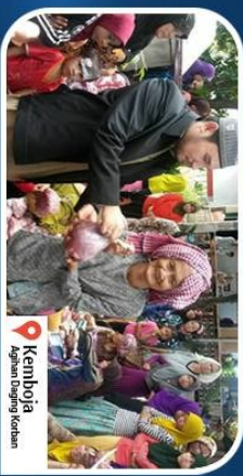
Kamboja Agiatan Ulangi Sekolah